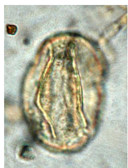
Quercus .robur (P=34µm)