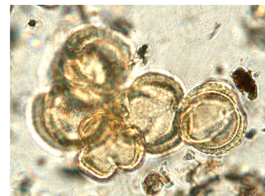
Pollini in ammassi ( Artemisia :23-28µm)

ATTENZIONE : nel lavoro è stato scritto per errore Carex cf. riparia anziché Carex cf. pendula