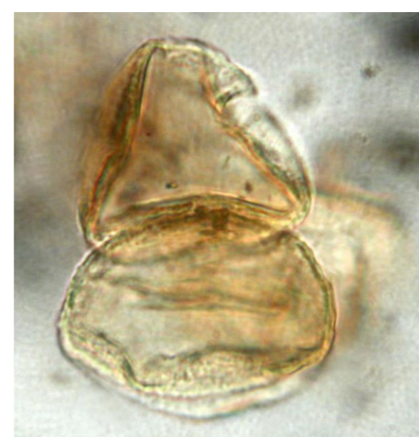
Pollini in ammassi ( Quercus =35µm)