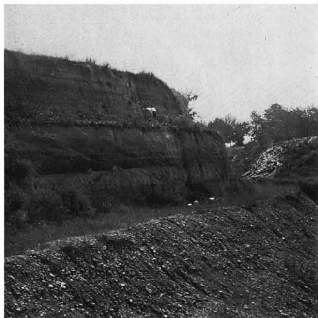
Fig. 1 - Cava S. Antonio presso Formigine (Modena). Lato settentrionale.

Non tutti i campioni hanno presentato un contenuto pollinico tale da permettere un'esauriente analisi, anche con metodi di arricchimento, ma sulla base di una quindicina di livelli si è potuto costruire un diagramma valido, pur con lacune causate a volta anche da livelletti ghiaiosi.