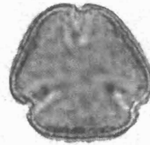
Quercus ilex L. visione polare