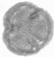
Quercus ilex L. visione polare