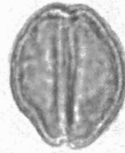
Quercus ilex L. bicolpato sincolpato