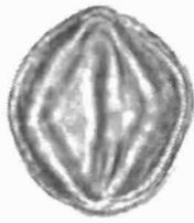
Quercus ilex L. visione equatoriale