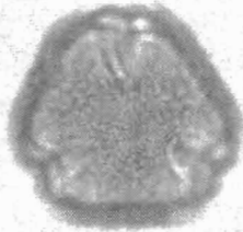
Quercus ilex L. visione polare